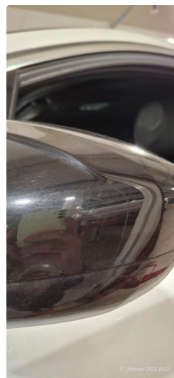
1.1 Deksel skadet/ripe