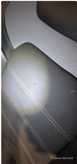
2.2 Skade på setepute