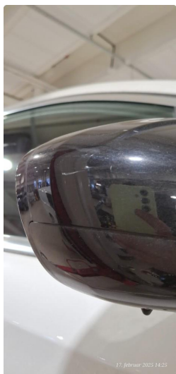
1.1 Deksel skadet/ripe