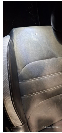
2.1 Skade på setepute