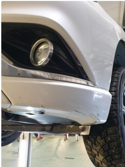
1.2 Skrubbskader underkant