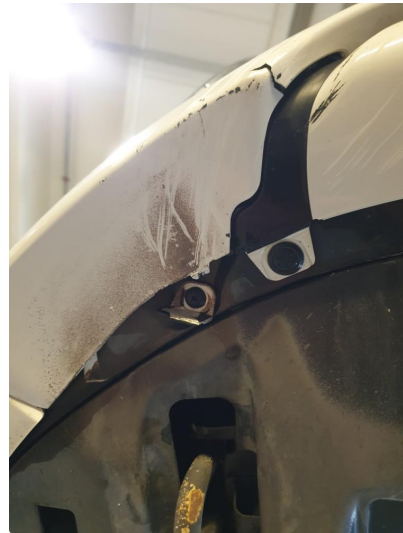
1.2 Skrubbskader underkant