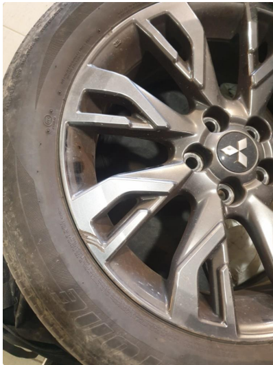
1.1 Skade på felg