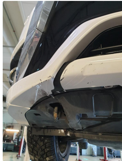
1.2 Skrubbskader underkant