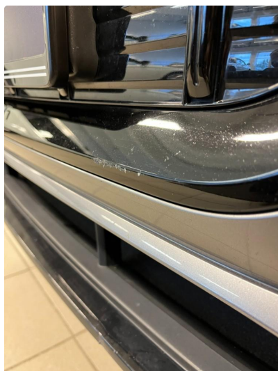
1.4 Sår på støtfanger, midtre del