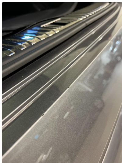
1.2 Noe sår etter innlastning/utlasting