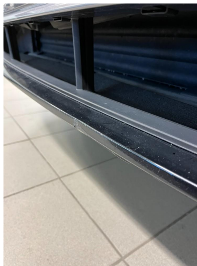
1.3 Sår på støtfanger, nedre del