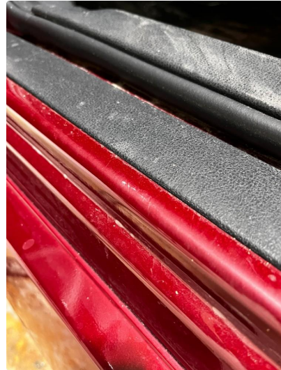
1.2 Litt slitt dørterskel, venstre foran