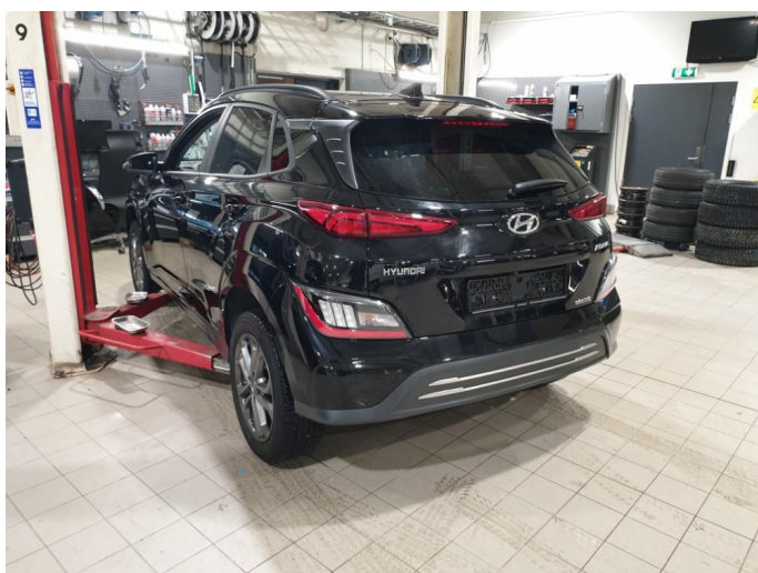
1.1 Generell bruksslitasje