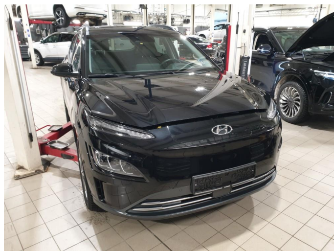
1.1 Generell bruksslitasje