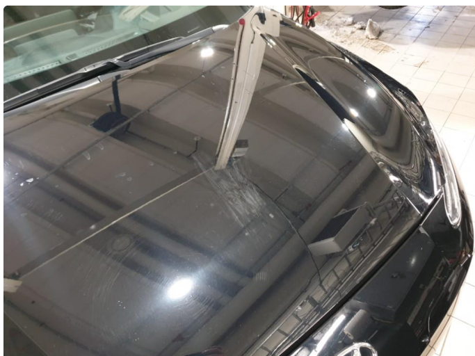
1.1 Generell bruksslitasje