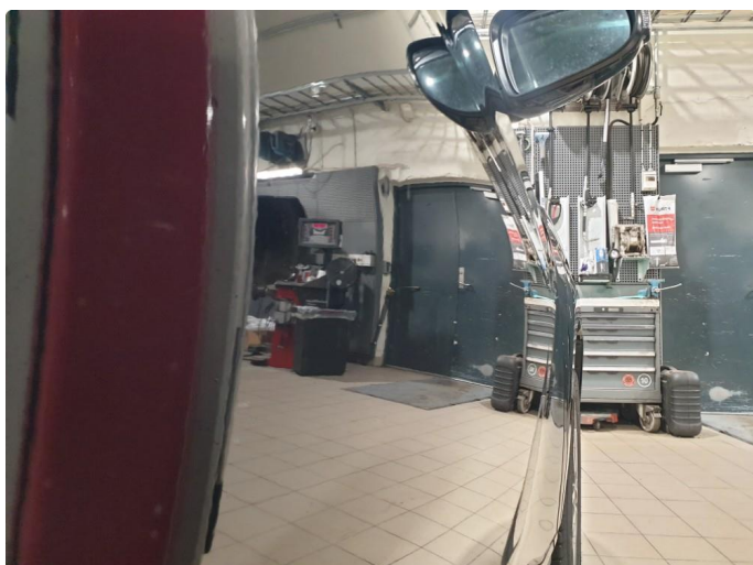
1.1 Generell bruksslitasje