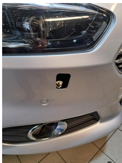
1.2 Lyktespyler deksel mangler