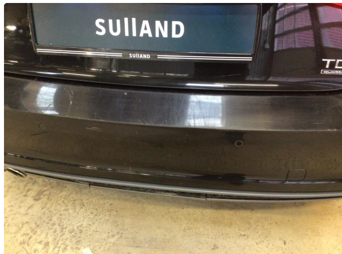
2.1 Øvrige feil