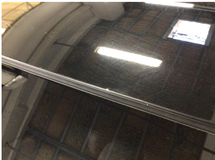
2.1 Øvrige feil