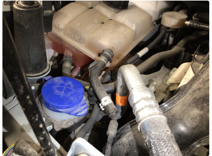
2.1 Kjøleveske under minimum