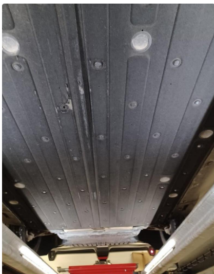
2.2 Mangler et klips på beskyttelsesplate under biler.