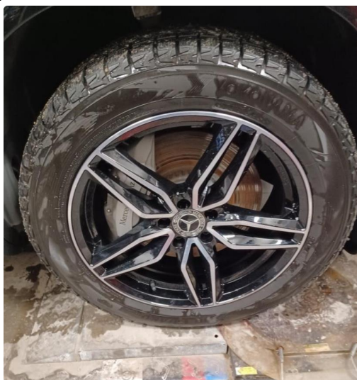
2.3 21" Sommerhjul med Michelin dekk og 19" vinterhjul med Yokohama pigfritt