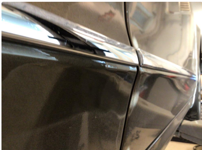
1.1 Noe riper i venstre framdør og høyre bakdør