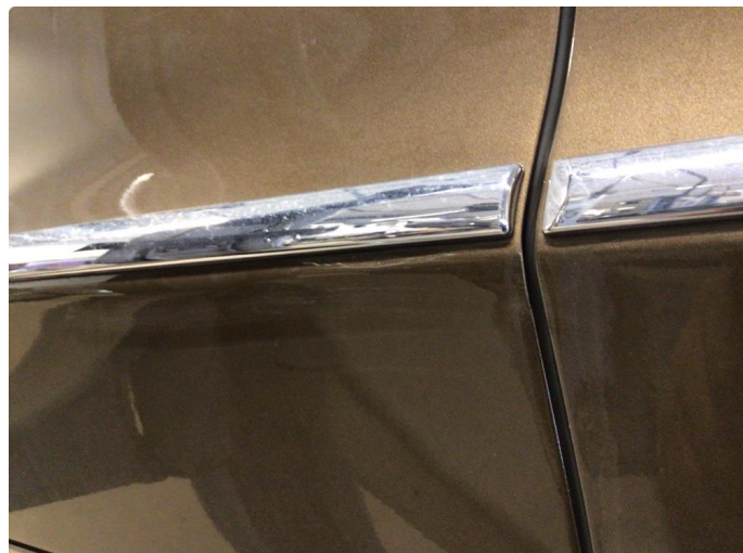
1.1 Noe riper i venstre framdør og høyre bakdør