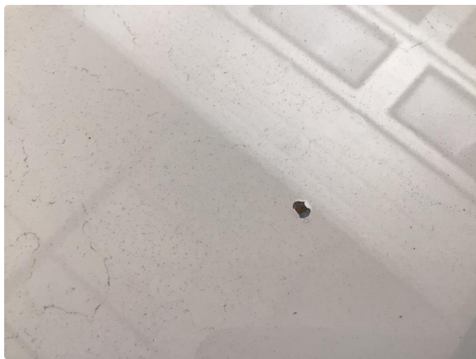
1.4 Lakk flasser