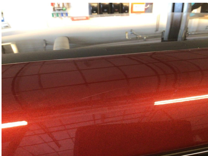
1.2 Øvrige feil