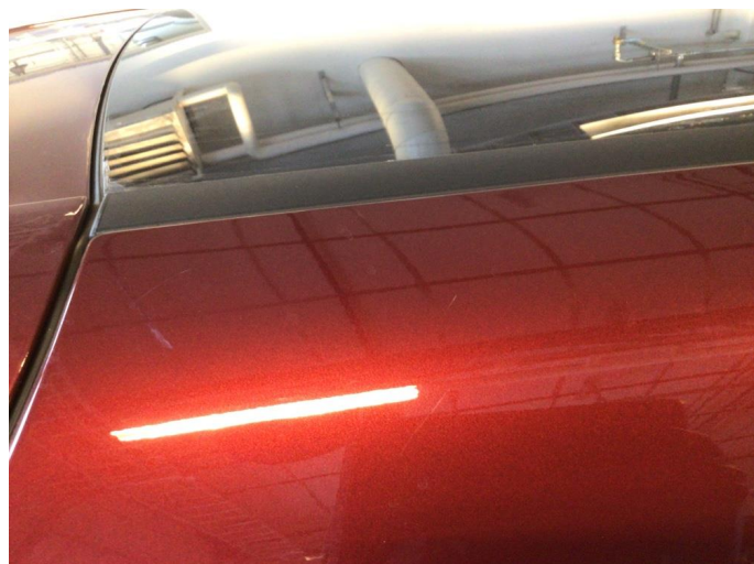
1.2 Øvrige feil