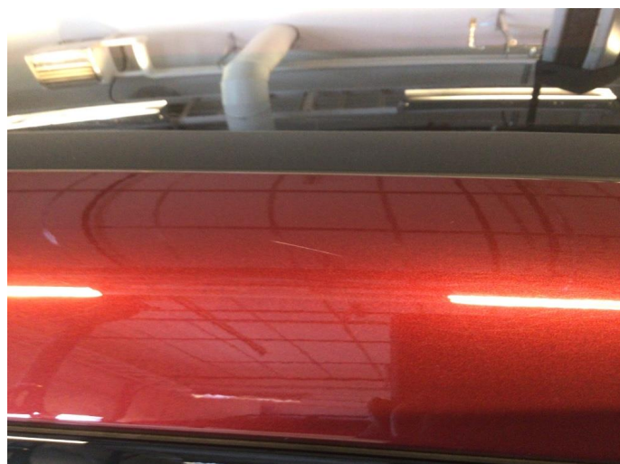
1.2 Øvrige feil