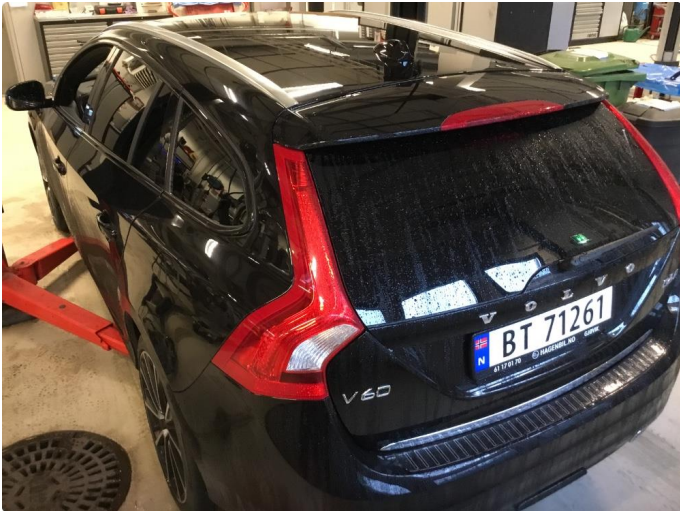
1.1 Øvrige feil