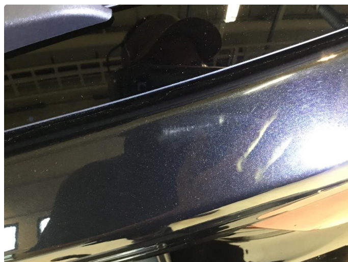
1.4 Noen riper