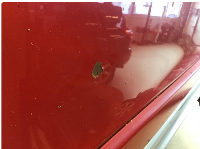
2.1 Steinsprut med rust