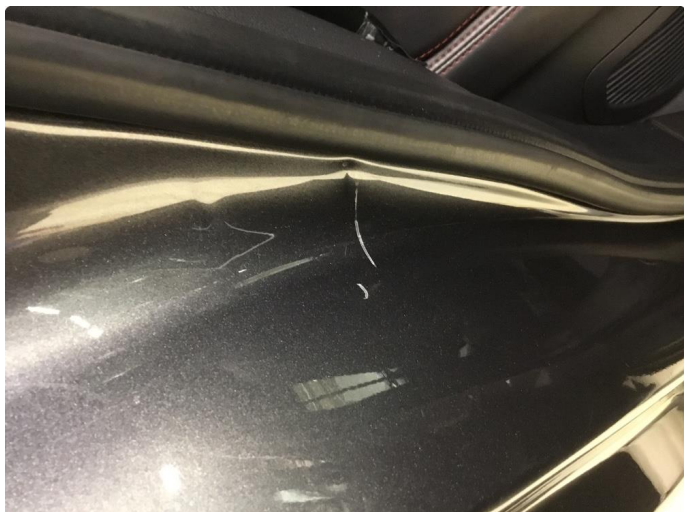
1.2 Bulk med lakkskade