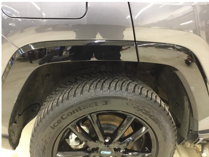
1.1 Skjermutbygger skadet