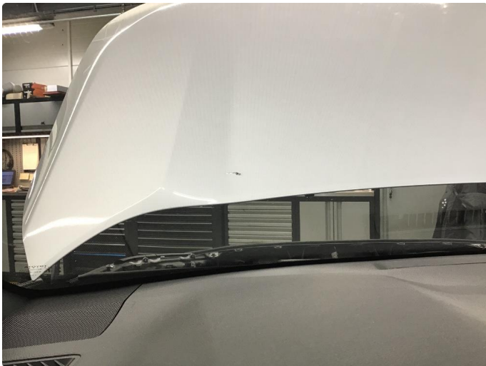
1.1 Steinsprut med sprekk i synsfelt