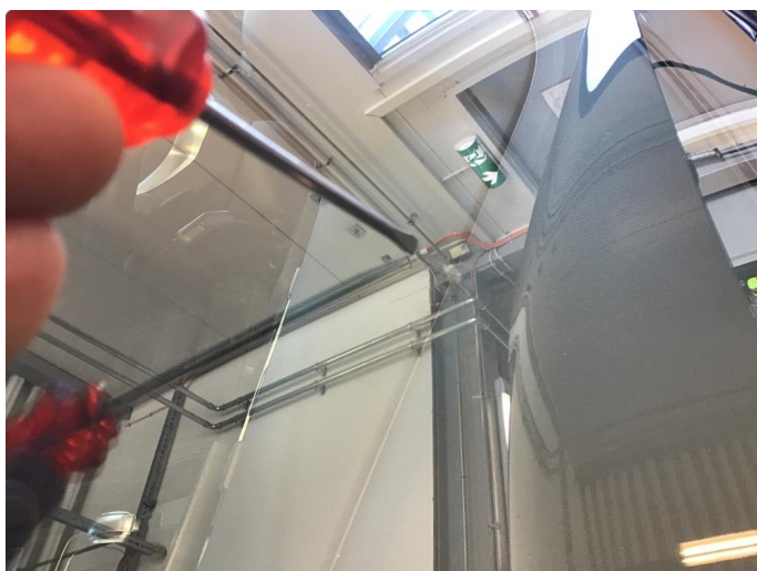
1.3 Steinsprut med sprekk utenfor synsfelt