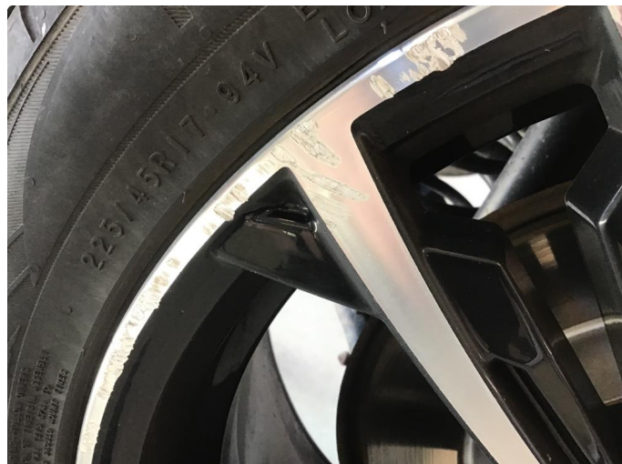
1.2 Kantkjørt felg