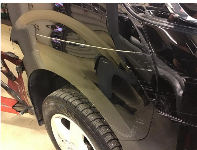
1.4 Bulk med lakkskade