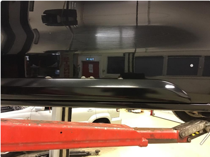
1.1 Lakk flasser