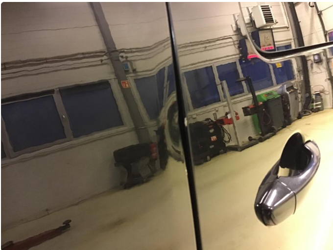
1.2 Bulk med lakkskade