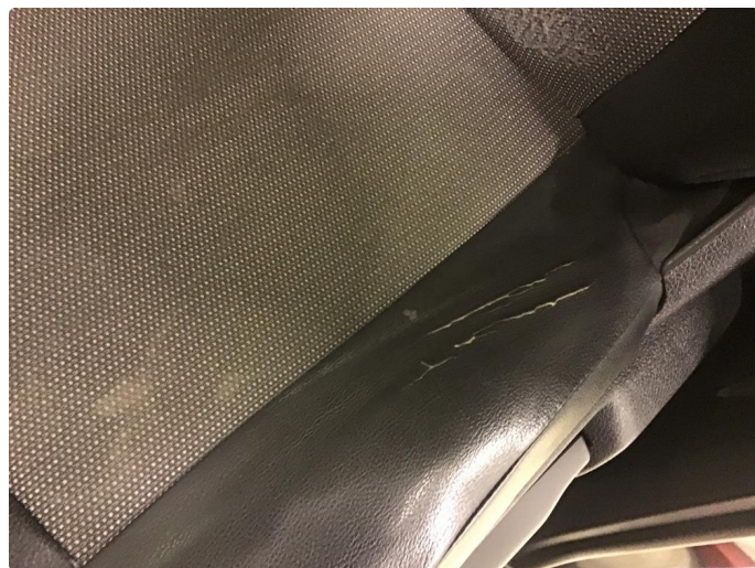
2.1 Skade på setepute