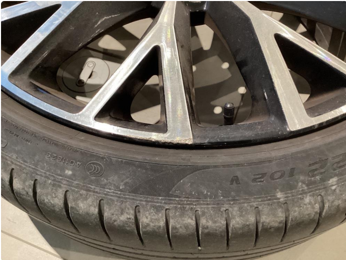
1.1 Noe kantkjørt felg Diamond Cut sommerfelg