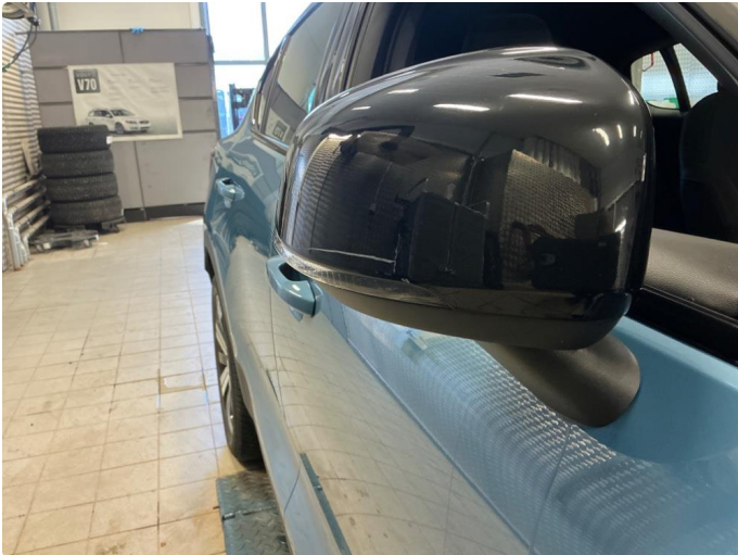
1.1 Speilhus riper