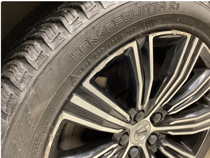
1.1 Kantskjørt felg