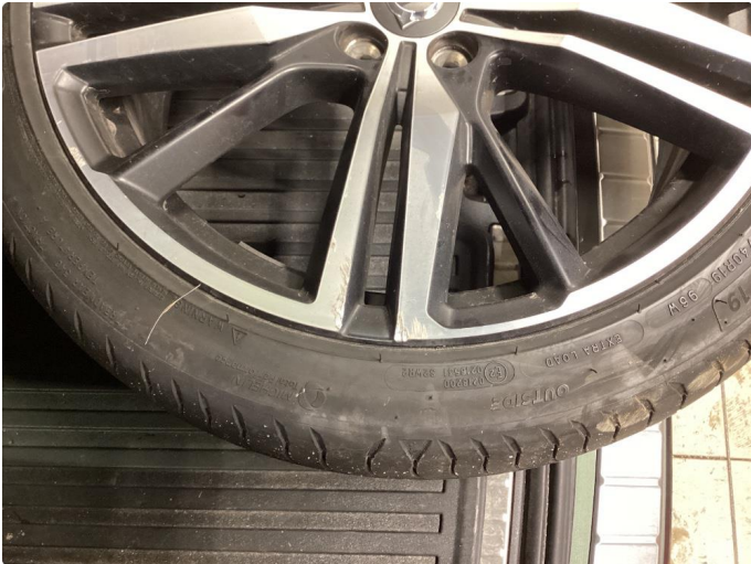
1.1 Kantskjørt sommerfelg Diamond Cut