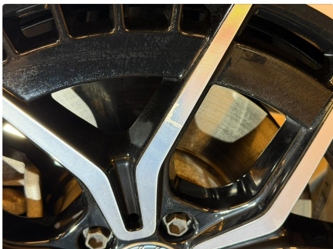
1.1 Kantkjørt felg - 2 stk. sommerhjul.