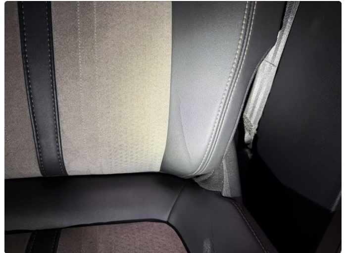
2.1 Skade på setepute