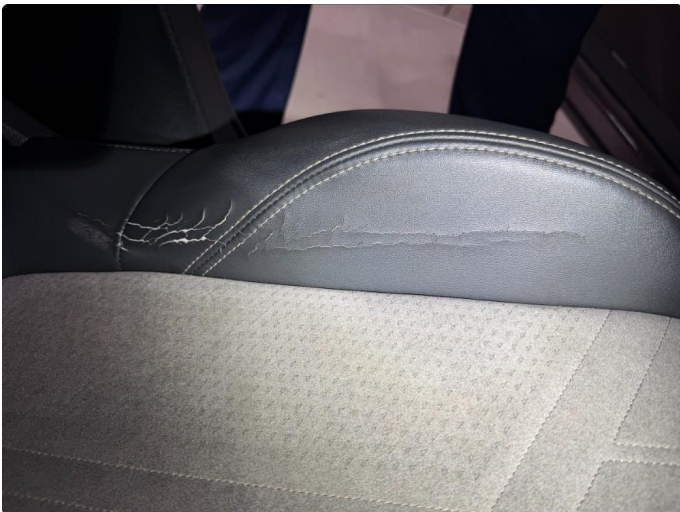
2.1 Skade på setepute