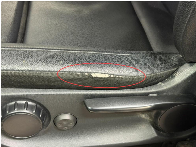
3.1 Skade på setepute.