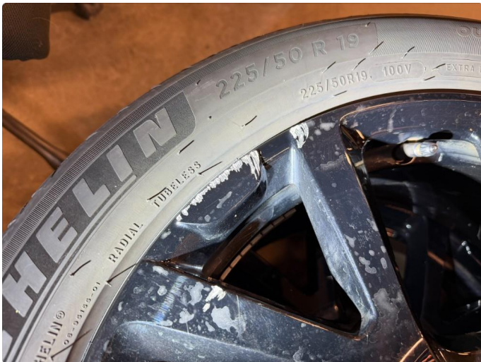
1.1 Kantkjørt felg - 1 stk. sommerhjul.