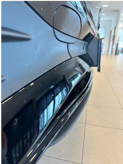
1.2 Ripe/ hakk i frontfanger.