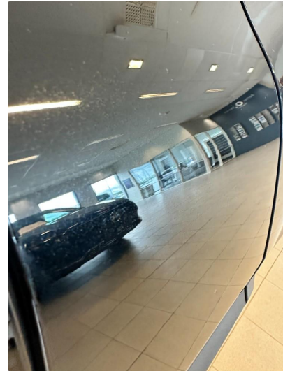
1.1 Liten ripe og bulk.