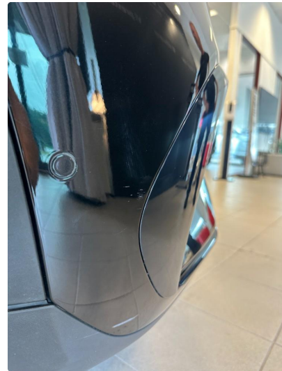
1.3 Små riper.