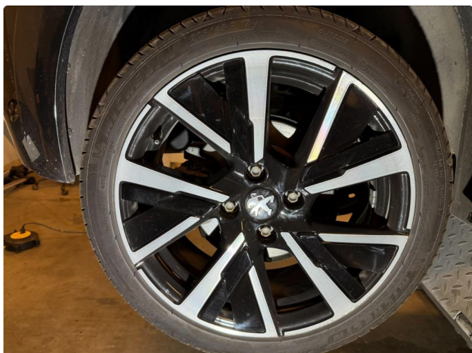
1.1 Kantkjørt felg - 3 stk. 17" sommerhjul.