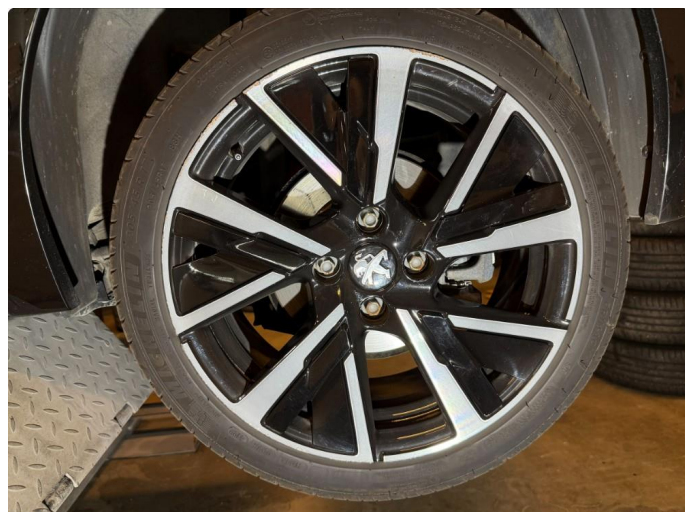
1.1 Kantkjørt felg - 3 stk. 17" sommerhjul.