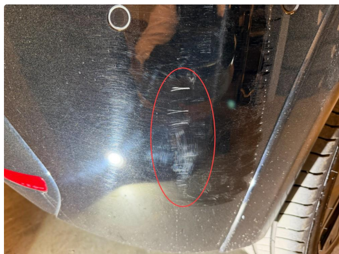
1.2 Ripe(r) ned til grunning.