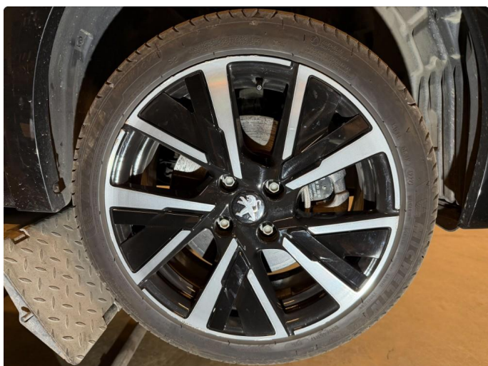
1.1 Kantkjørt felg - 3 stk. 17" sommerhjul.