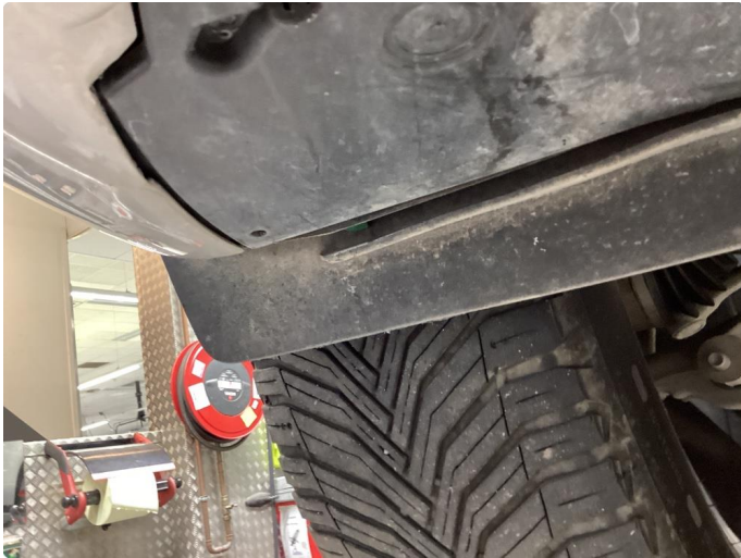
1.1 Øvrige feil