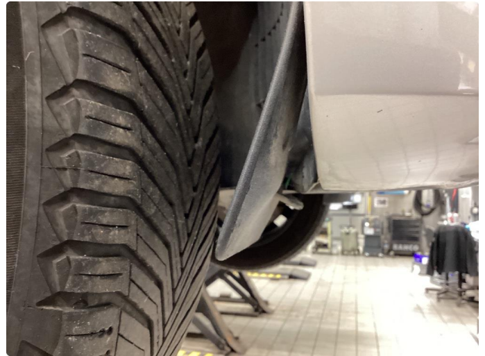
1.1 Øvrige feil