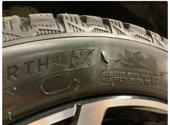
1.2 Dekkskade vinterhjul