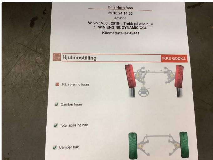
3.1 Øvrige feil