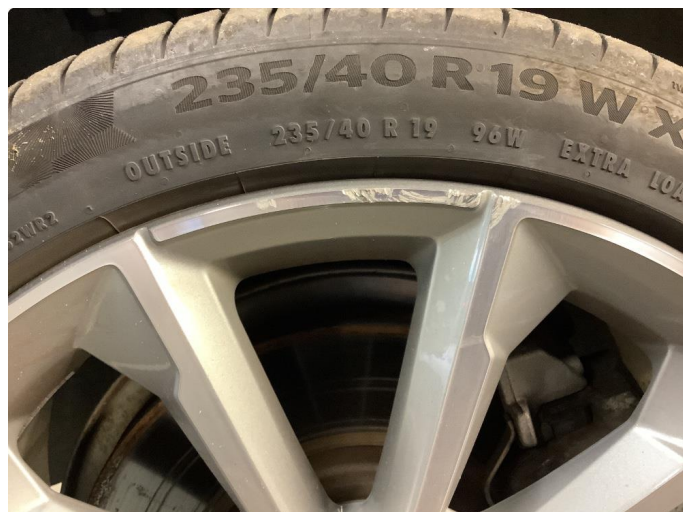
2.1 Kantkjørt felg