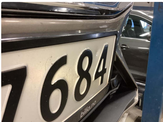
1.1 Skadet/ikke lesbart