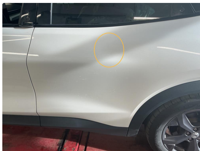
1.2 Noe steinsprut