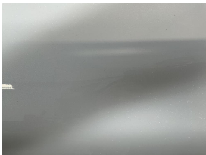
1.2 Noe steinsprut