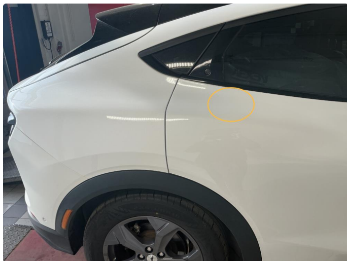
1.3 Noe steinsprut