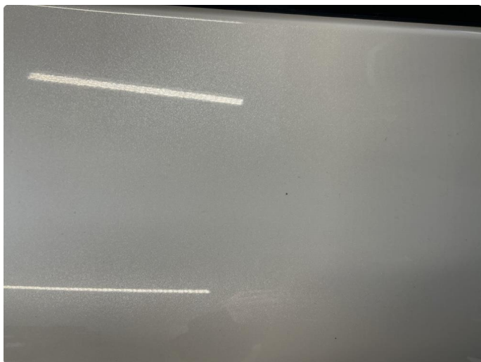
1.3 Noe steinsprut