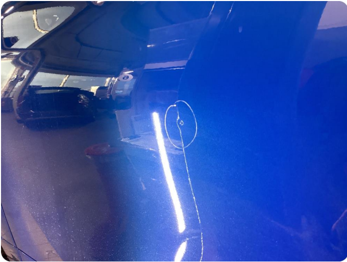
1.1 Bulk V. Fordør