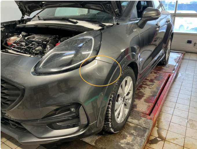
1.1 Ufagmessig utført arbeid