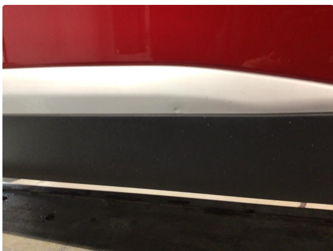
1.2 Liten bulk i plast list nede på høyre fordør.