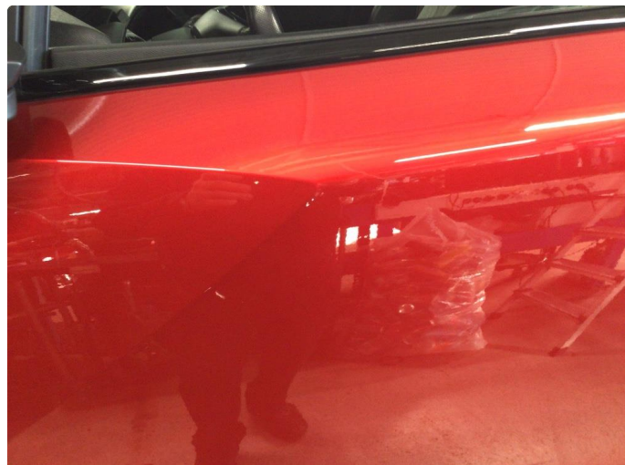
1.1 Noe steinsprut på front og sidene