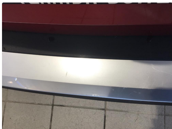
1.3 Noen riper på plast deksel lastesone på bakfanger.