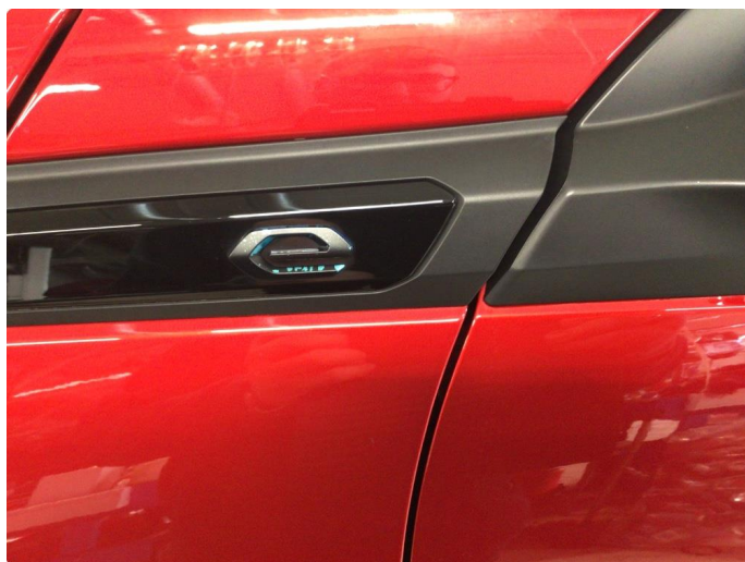
1.4 Grønn fargen på E logoen vs foran, og bake hs flasset noe av.