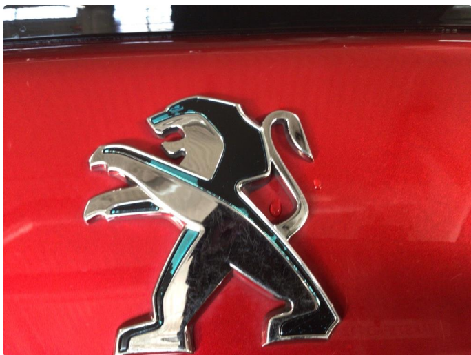
1.4 Grønn fargen på E logoen vs foran, og bake hs flasset noe av.