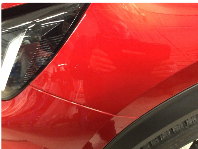
1.1 Noe steinsprut på front og sidene