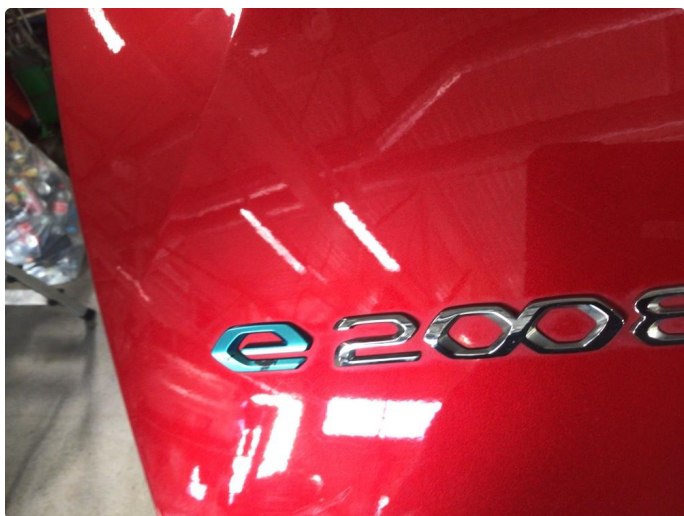
1.4 Grønn fargen på E logoen vs foran, og bake hs flasset noe av.