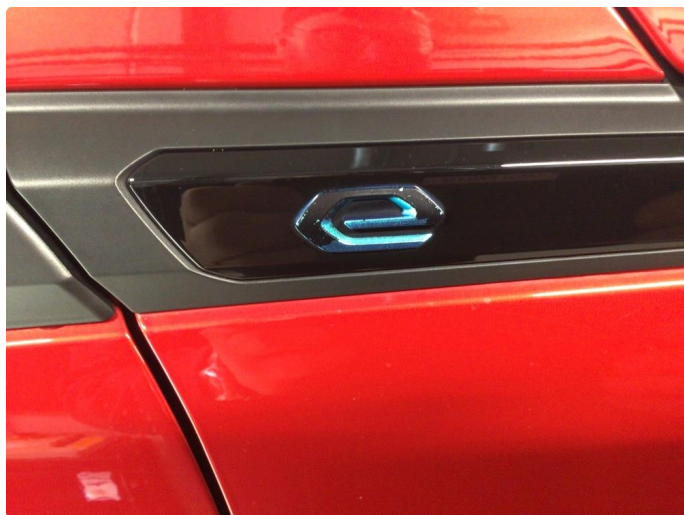
1.4 Grønn fargen på E logoen vs foran, og bake hs flasset noe av.