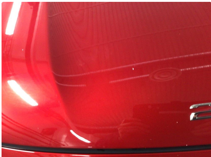
1.1 Noe steinsprut på front og sidene