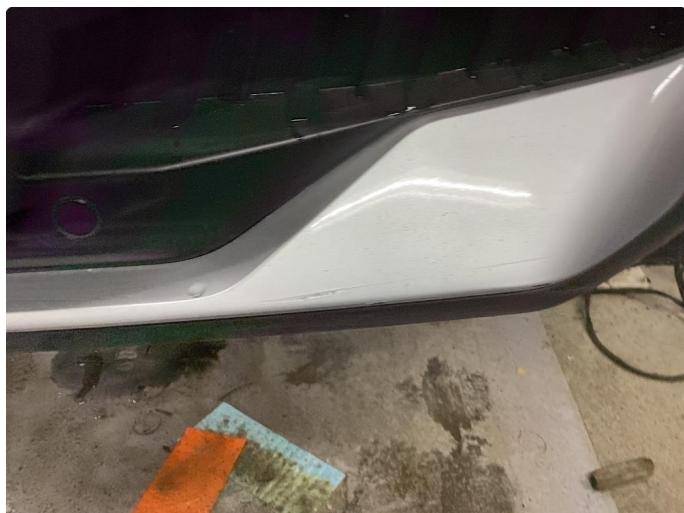
1.2 Noen riper i støtfanger foran nede til venstre på grått deksel