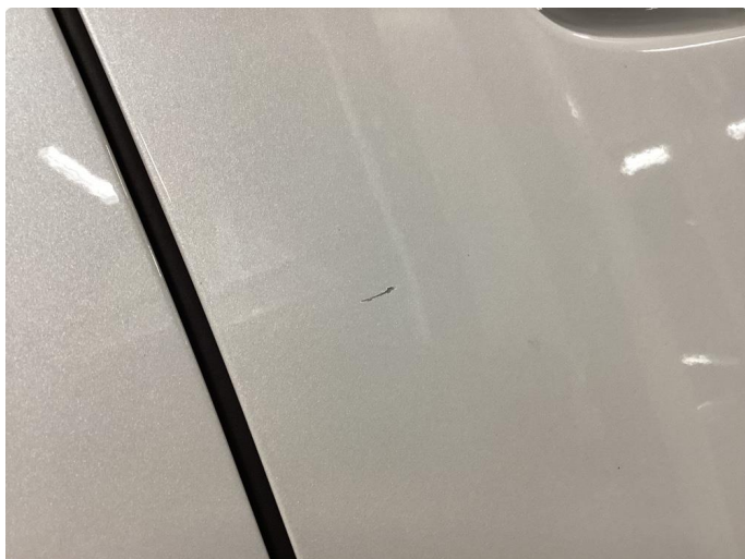
1.1 Liten lakkskade på dør hsf