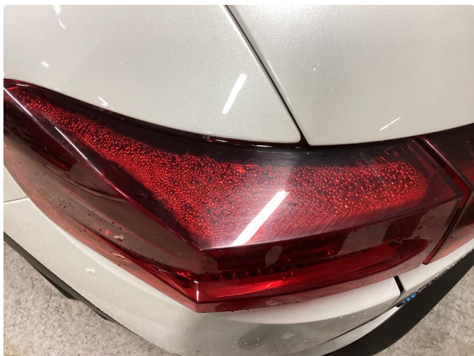
1.1 Liten lakkskade på dør hsf