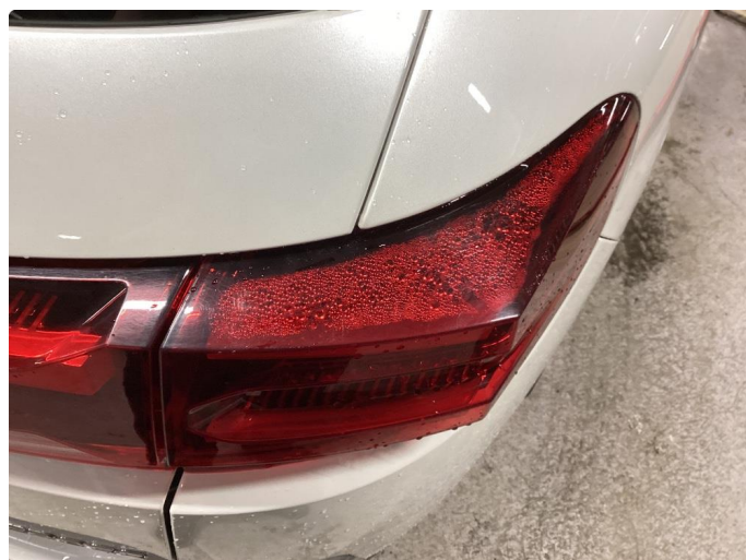
1.1 Liten lakkskade på dør hsf