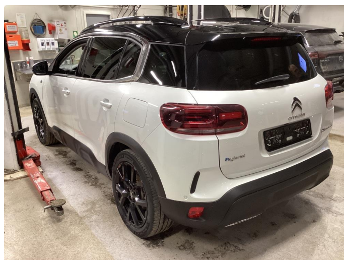
1.1 Liten lakkskade på dør hsf