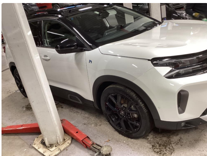
1.1 Liten lakkskade på dør hsf