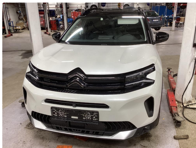
1.1 Liten lakkskade på dør hsf