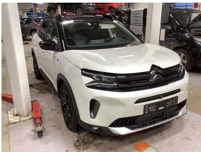
1.1 Liten lakkskade på dør hsf