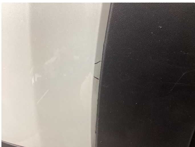
1.1 Liten lakkskade på dør hsf