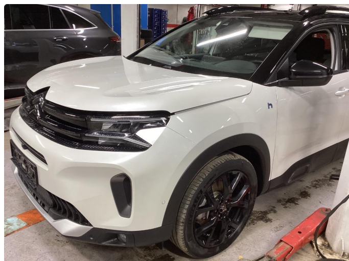
1.1 Liten lakkskade på dør hsf