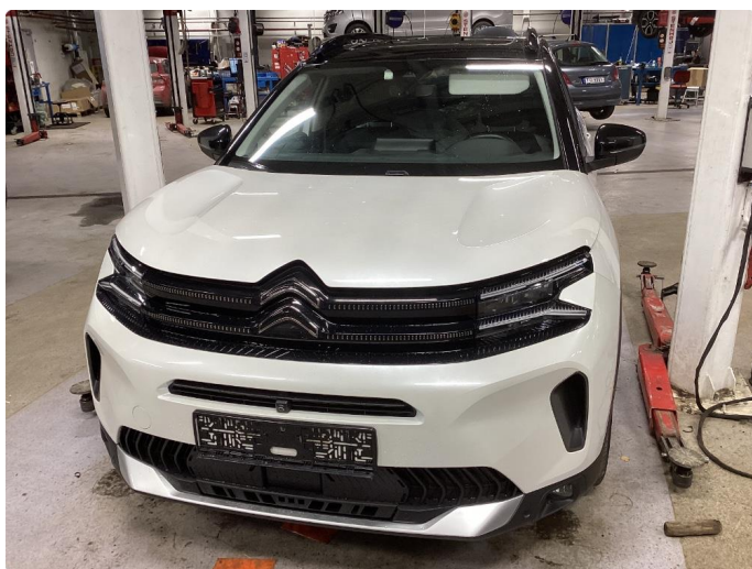
1.1 Liten lakkskade på dør hsf