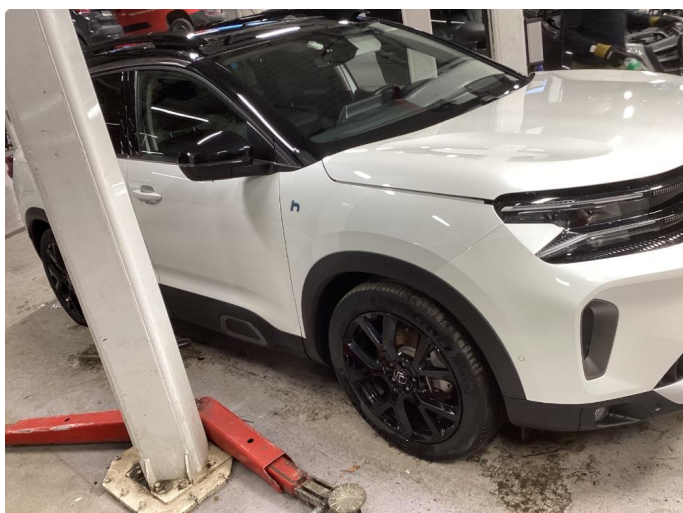
1.1 Liten lakkskade på dør hsf