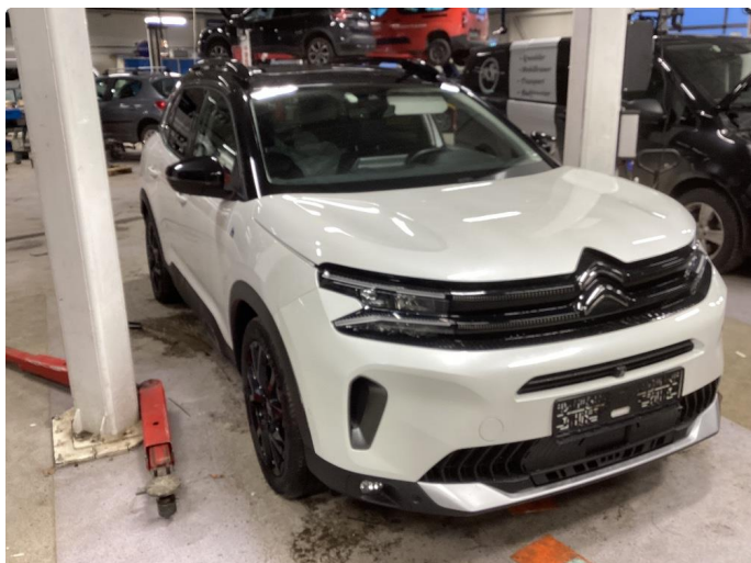
1.1 Liten lakkskade på dør hsf