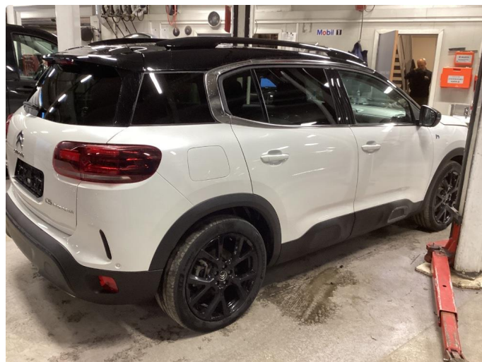
1.1 Liten lakkskade på dør hsf