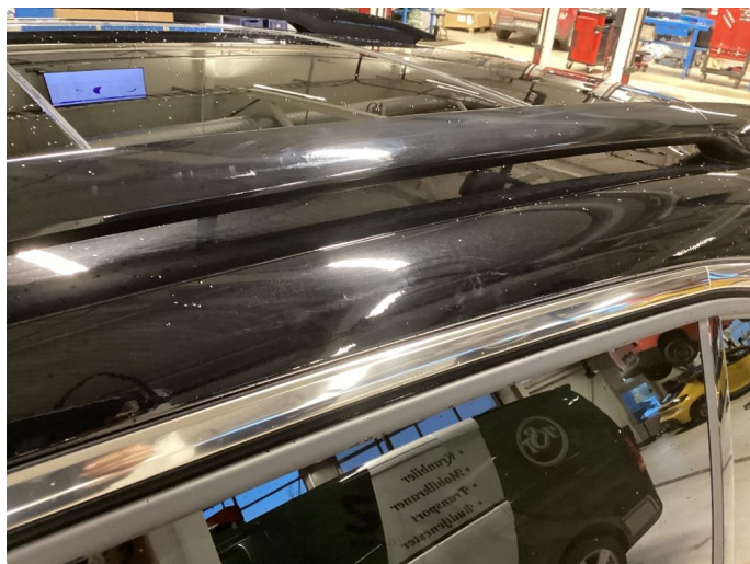
1.1 Liten lakkskade på dør hsf