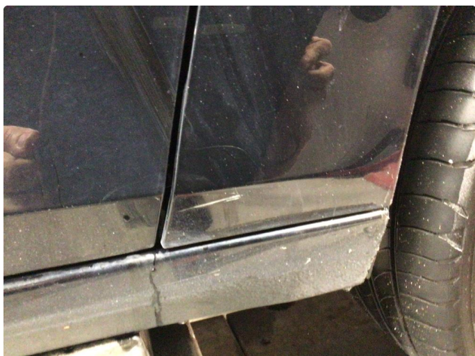
1.1 Ripe nede på høyre forskjerm