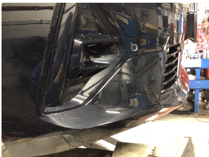
1.3 Noe steinsprang nede på frontfanger.