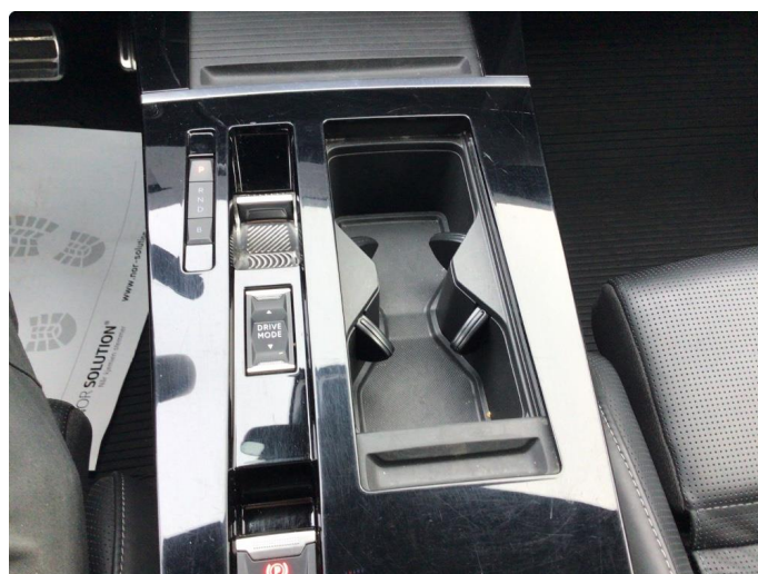
2.1 Noen riper på midtkonsoll deksel.