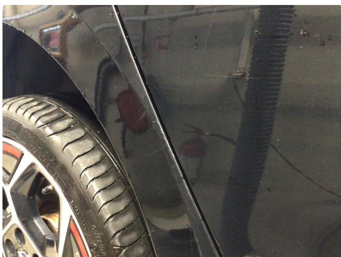
1.4 Noen riper på kanal høyre side og oppe i døråpning på bakdør.