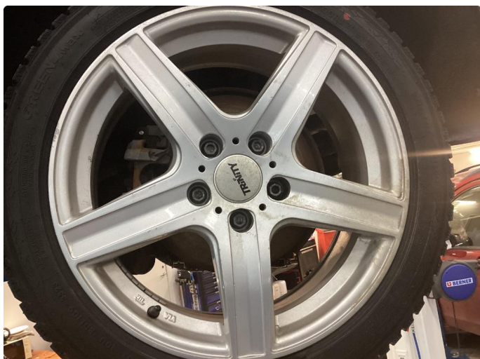
1.1 Små skade på venstre bak vinter felg