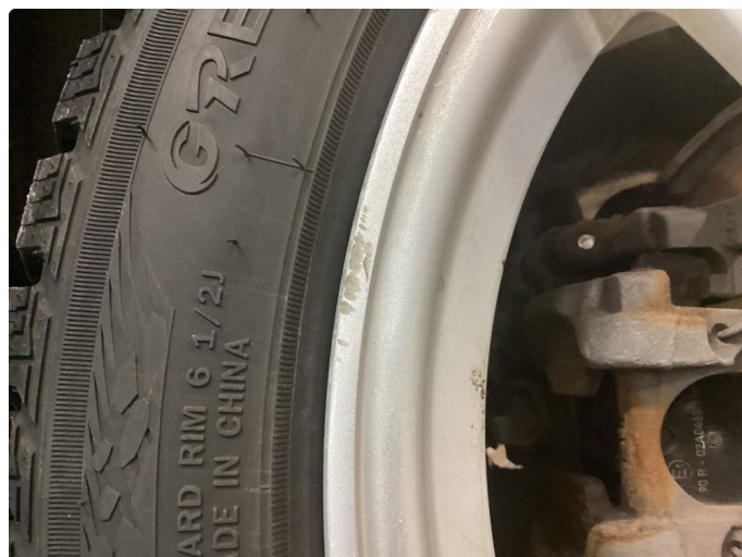
1.1 Små skade på venstre bak vinter felg