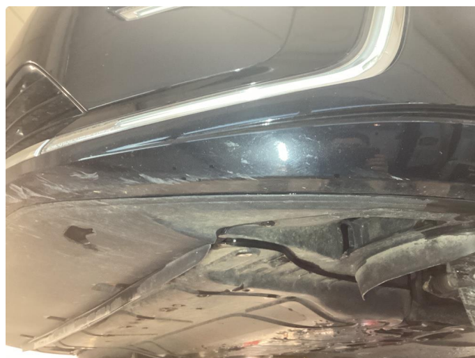
1.2 Riper under frontfanger