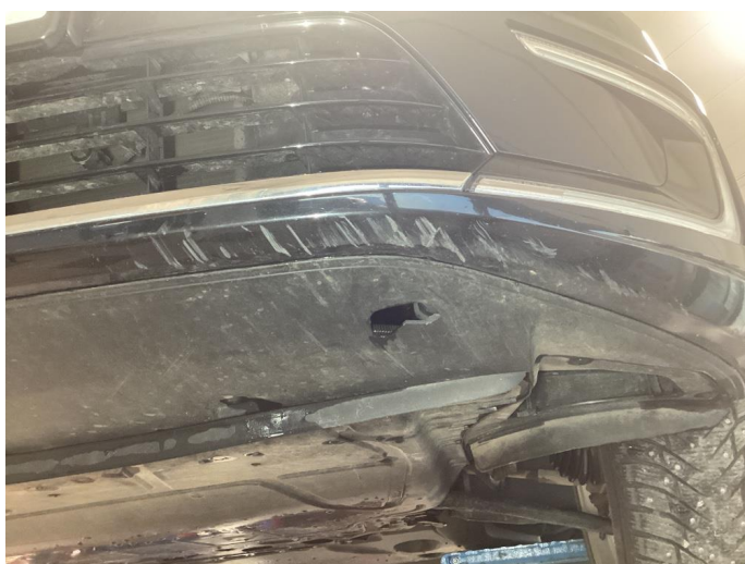
1.2 Riper under frontfanger