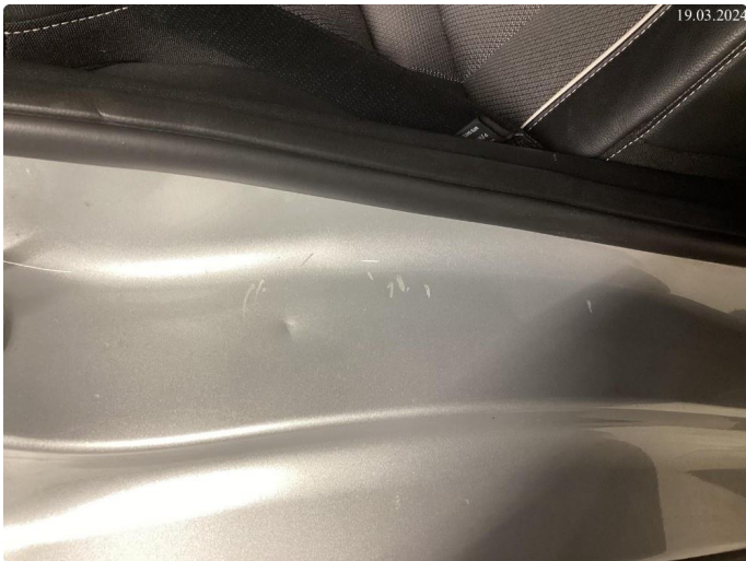
1.2 Noen riper og småbulker