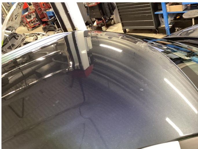
1.4 Noe steinsprut på tak rett over frontrute.