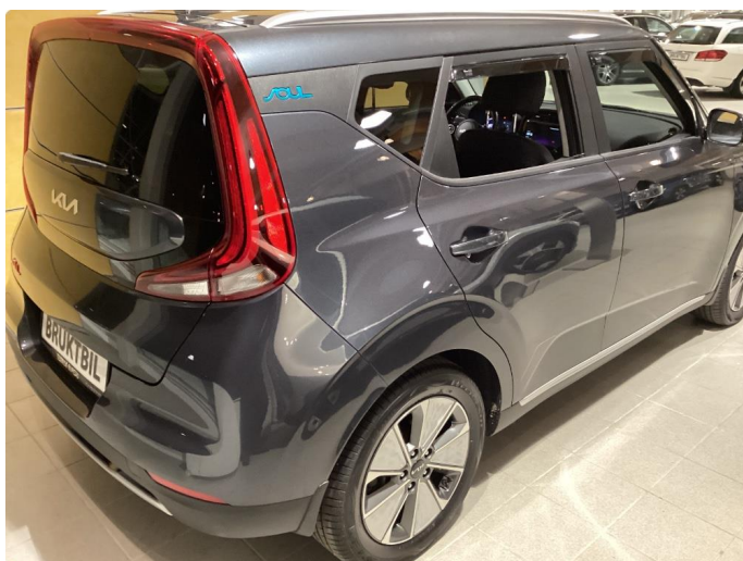
1.1 Noe steinsprut i panser som er flekket i.