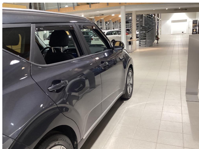
1.1 Noe steinsprut i panser som er flekket i.