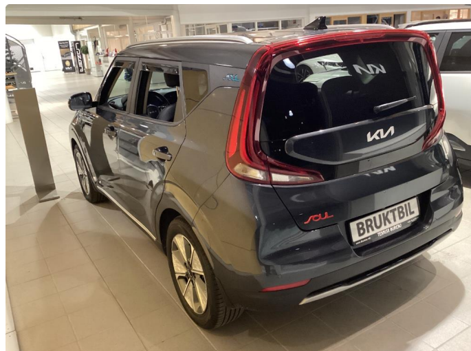
1.1 Noe steinsprut i panser som er flekket i.