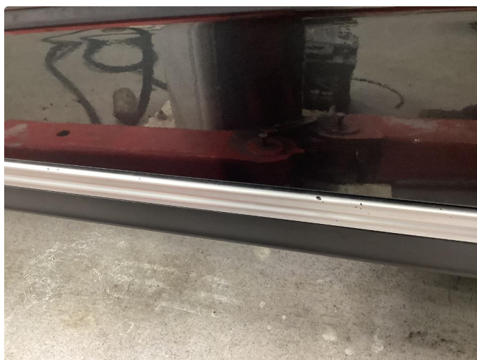
1.2 Grått deksel rett under førerdør har noen steinsprang.