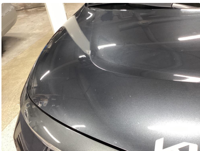
1.1 Noe steinsprut i panser som er flekket i.