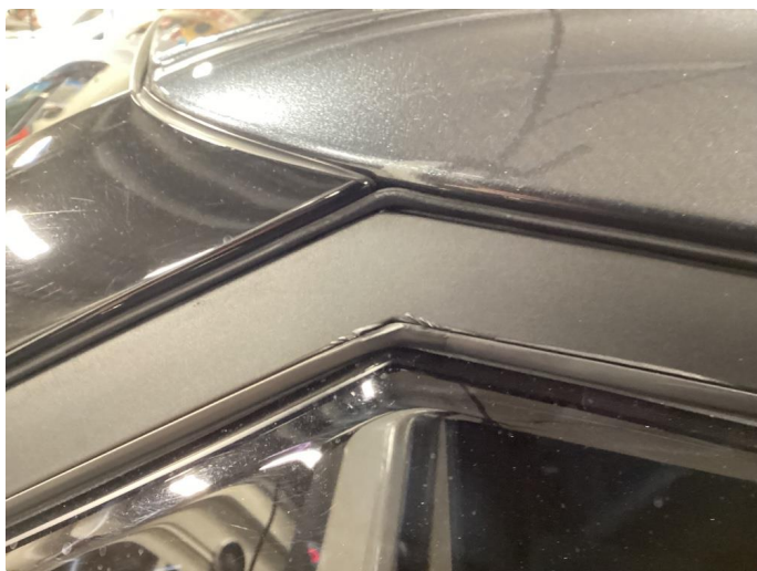
1.3 Det er lagt folie på vinduskarmer i alle 4 dører. Folien er krøllet seg noen plasser.