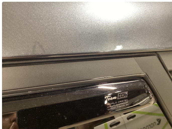
1.3 Det er lagt folie på vinduskarmer i alle 4 dører. Folien er krøllet seg noen plasser.