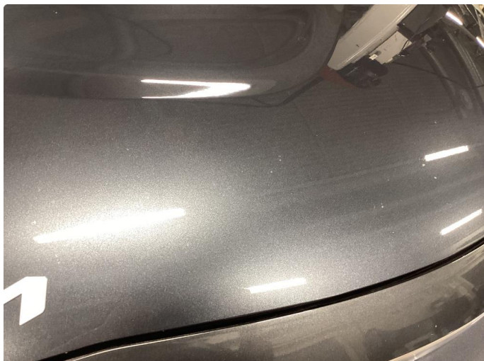
1.1 Noe steinsprut i panser som er flekket i.