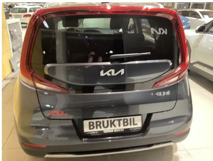
1.1 Noe steinsprut i panser som er flekket i.