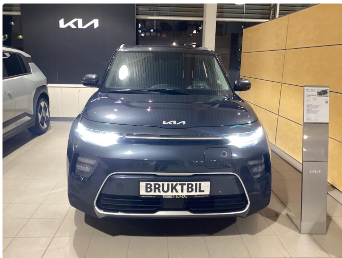
1.1 Noe steinsprut i panser som er flekket i.