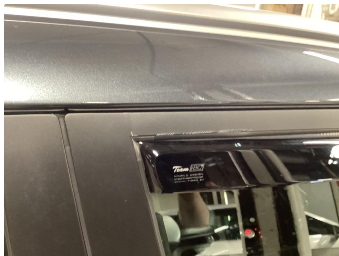
1.3 Det er lagt folie på vinduskarmer i alle 4 dører. Folien er krøllet seg noen plasser.