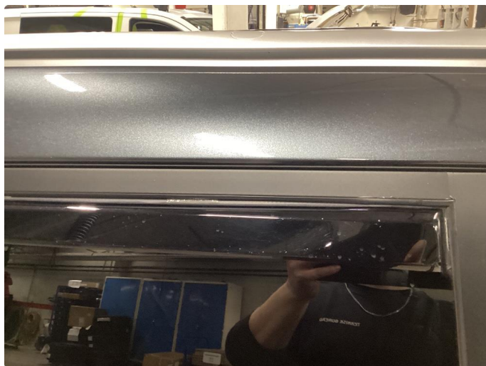
1.3 Det er lagt folie på vinduskarmer i alle 4 dører. Folien er krøllet seg noen plasser.