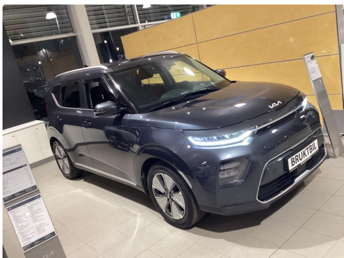
1.1 Noe steinsprut i panser som er flekket i.