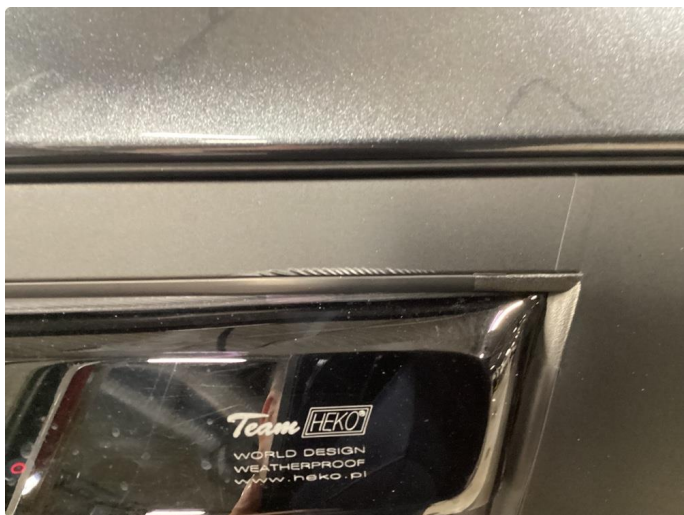
1.3 Det er lagt folie på vinduskarmer i alle 4 dører. Folien er krøllet seg noen plasser.