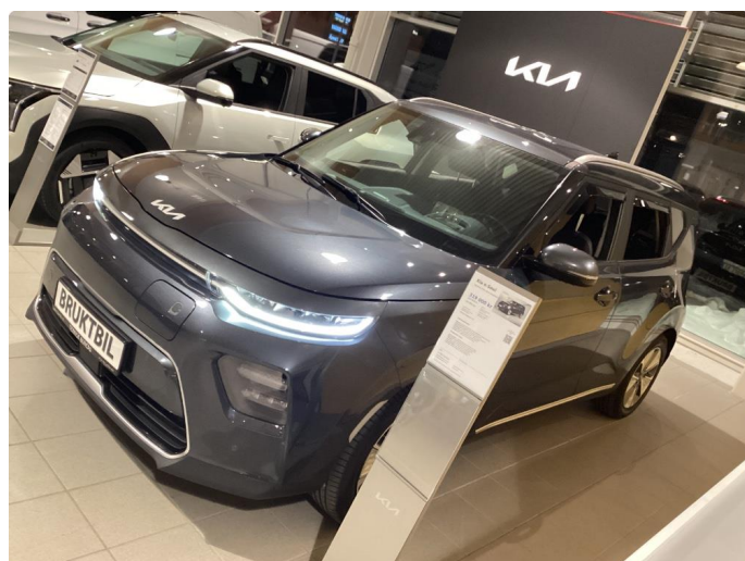
1.1 Noe steinsprut i panser som er flekket i.