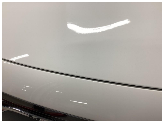
1.2 Små steinsprank