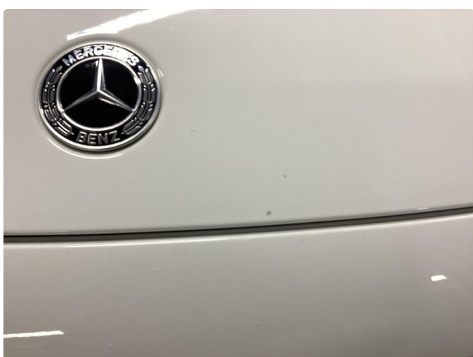
1.2 Små steinsprank