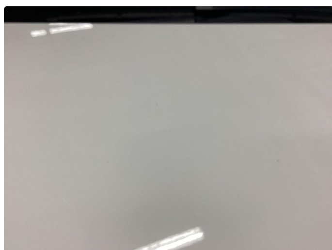
1.2 Små steinsprank