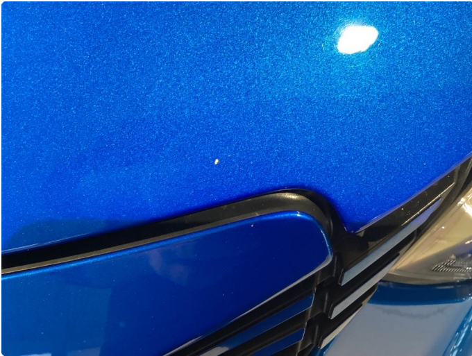
1.1 Noe steinsprut i front av bilen,